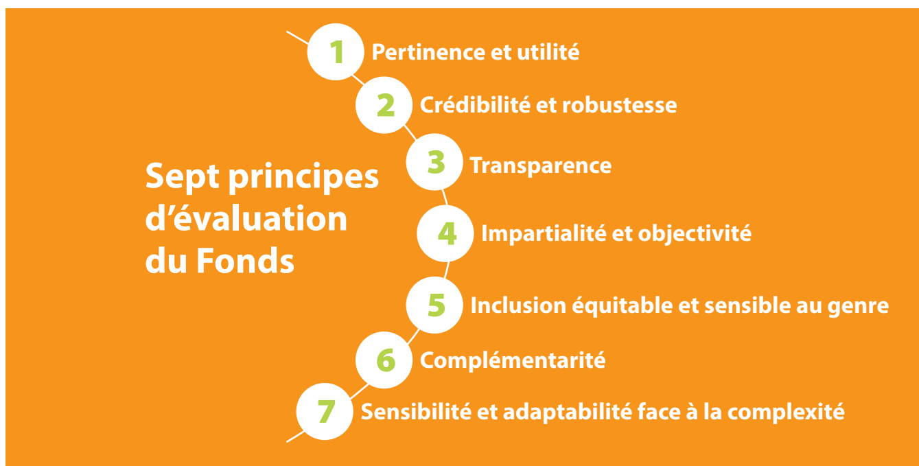
Figure 2 : Les sept principes d'évaluation du Fonds pour l'adaptation

Les trois points importants à noter au sujet des principes d'évaluation du Fonds sont les suivants :