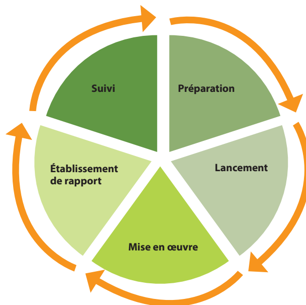
Figure 2 : Les phases d'évaluation

Il peut être difficile de détailler un budget d'évaluation à l'avance. Une estimation générale peut être budgétisée pour les besoins d'évaluation dans l'optique d'élaborer un budget plus détaillé plus tard dans le cycle du projet, une fois que les besoins d'évaluation du projet auront été mieux appréhendés et que l'expertise est en place.