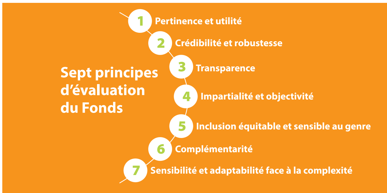
Figure 2 : Les sept principes d'évaluation du Fonds pour l'adaptation

Les trois points importants à noter au sujet des principes d'évaluation du Fonds sont les suivants :