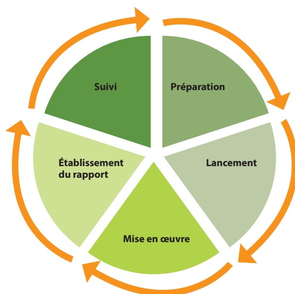
Figure 2 : Les étapes clés de l'évaluation

Des termes de référence doivent être préparés tôt dans le cadre de la phase de préparation d'une évaluation (voir la figure 2 ). Il faut consacrer suffisamment de temps à l'élaboration des termes de référence, car il s'agit non seulement de rédiger le texte, mais aussi de consulter les principales parties prenantes pour recueillir des avis, effectuer des révisions et obtenir des approbations.