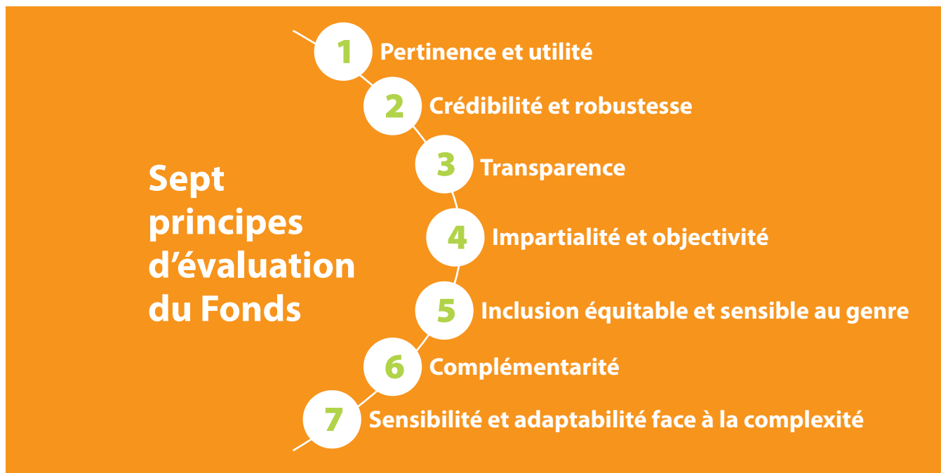
Figure 3 : Les sept principes d'évaluation du Fonds pour l'adaptation

✓ Être réaliste. Les termes de référence définissent les attentes en ce qui concerne les objectifs, les délais, les budgets et d'autres ressources. Il peut être difficile de trouver le bon équilibre entre tous ces facteurs, surtout lorsqu'un haut niveau de rigueur est requis. Une évaluation de l'évaluabilité peut aider à définir des attentes réalistes, mais si cela n'est pas possible, un processus itératif de consultation et de réflexion est vivement recommandé.